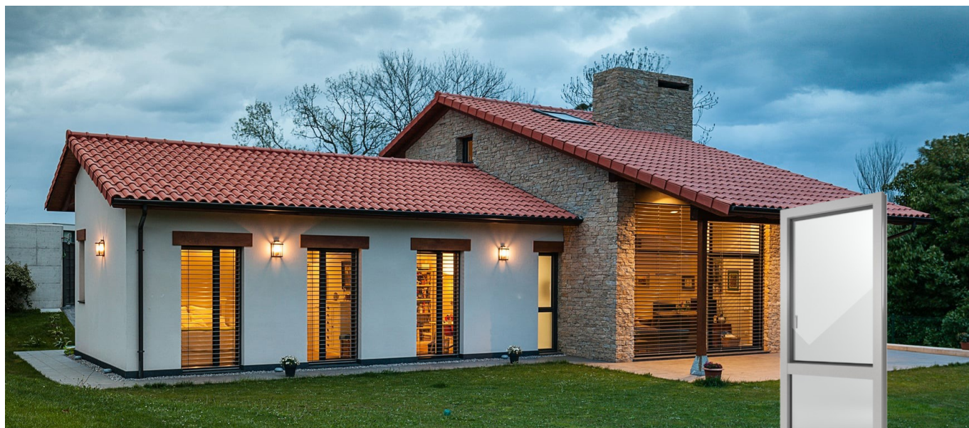
FIN-Window Nova-line N 90+8 Aluminium-PVC