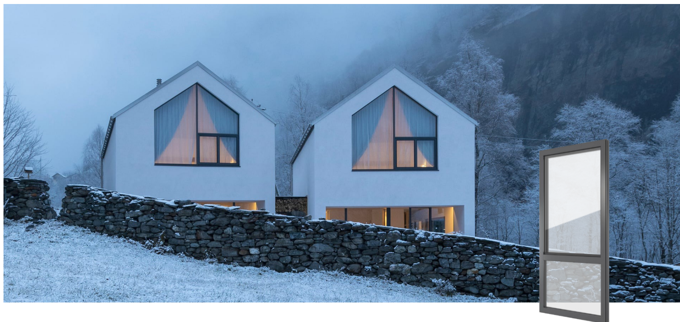
FIN-Project Nova-line 78/88 Aluminium-Aluminium