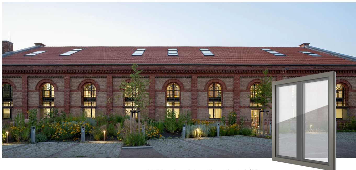
FIN-Project Nova-line Plus 78/88 Alumínio-alumínio