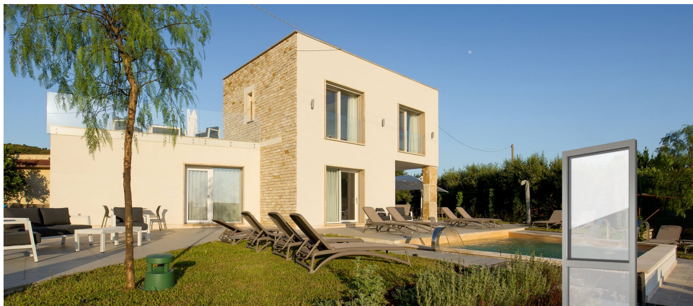
FIN-72 Nova-line 72 PVC-PVC