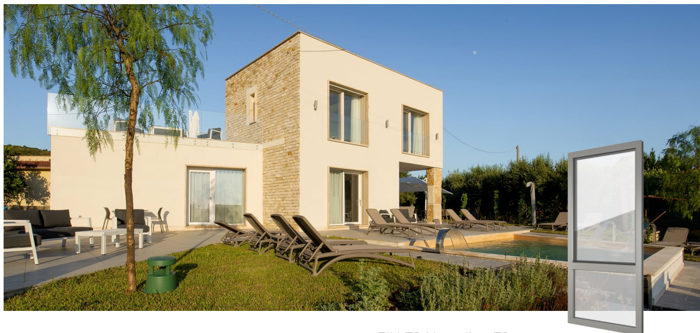
FIN-72 Nova-line 72 Kunststof-Kunststof