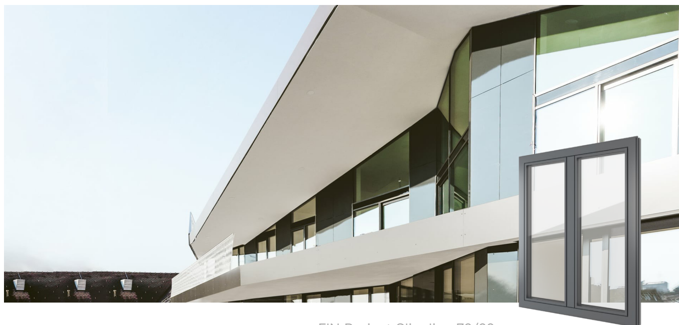
FIN-Project Slim-line 78/88 Aluminium-Aluminium