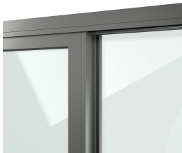
Einflügelige Schiebetür, außen und innen Aluminium Umbragrau F722, Randemaillierungsfarbe Tiefschwarz G01