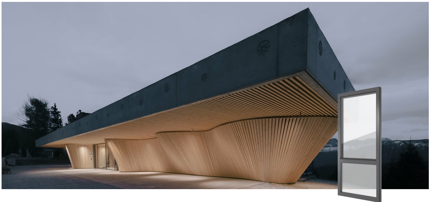
FIN-Project Nova-line 78/88 Aluminium-Aluminium