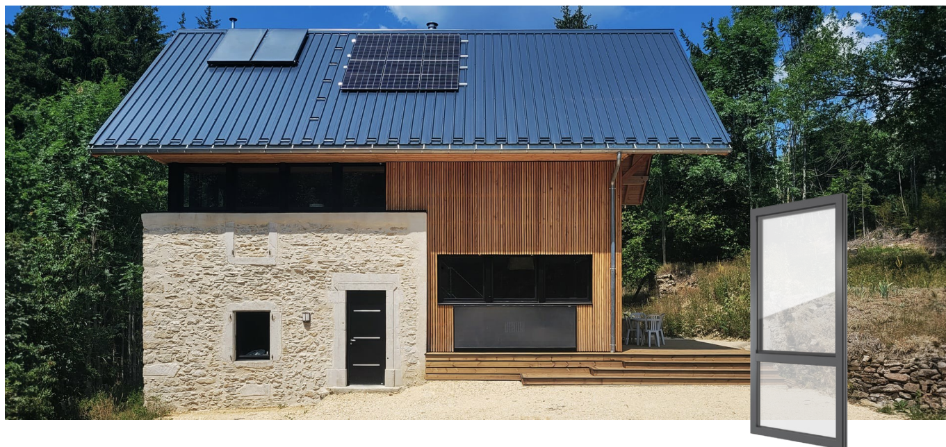
FIN-Project Nova-line 78/88 alluminio-alluminio