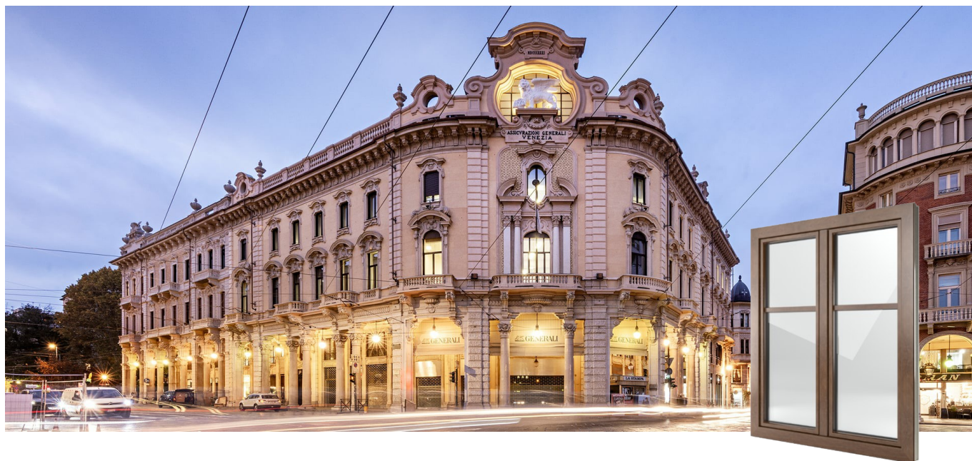
FIN-Window Classic-line 77+8 Alumínio-PVC