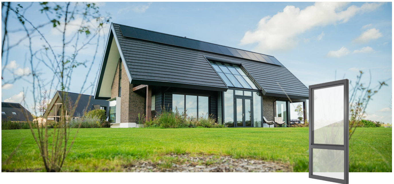
FIN-Project Nova-line 78/88 Aluminium-Aluminium