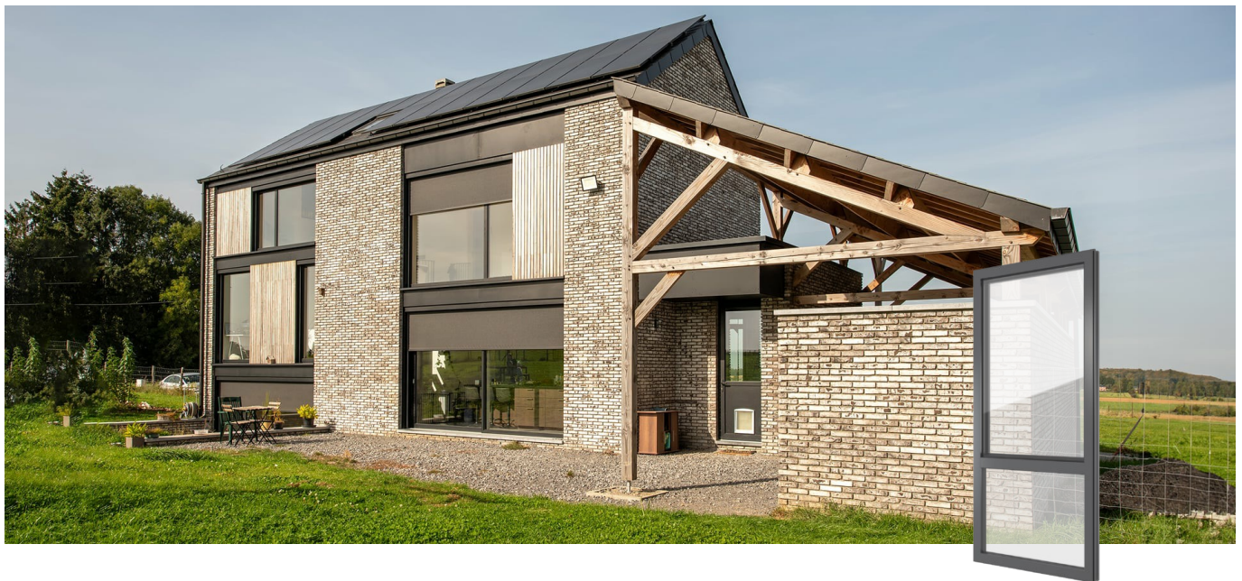
FIN-Project Nova-line 78/88 Aluminium-Aluminium