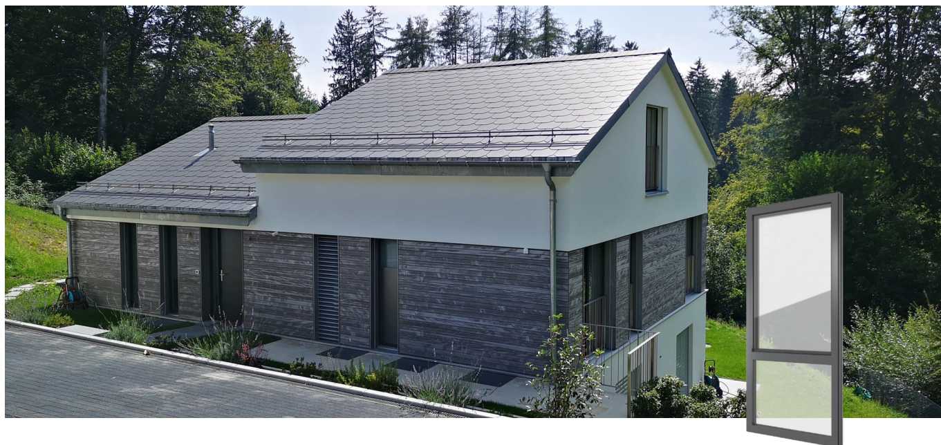
FIN-Project Nova-line 78/88 alluminio-alluminio