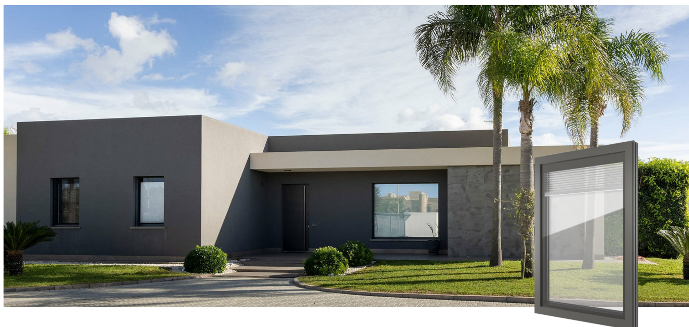
FIN-Project Nova-line Twin 78/88 Alumínio-alumínio