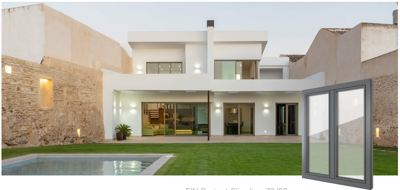
FIN-Project Slim-line 78/88 Aluminio-Aluminio