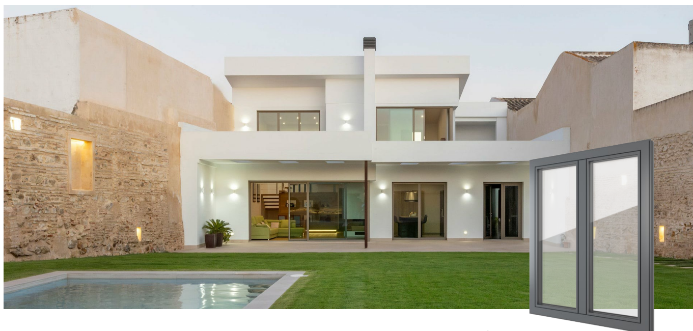
FIN-Project Slim-line 78/88 Aluminium-Aluminium