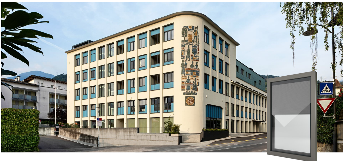
FIN-Window Nova-line Twin 77+8 Aluminium-Kunststof