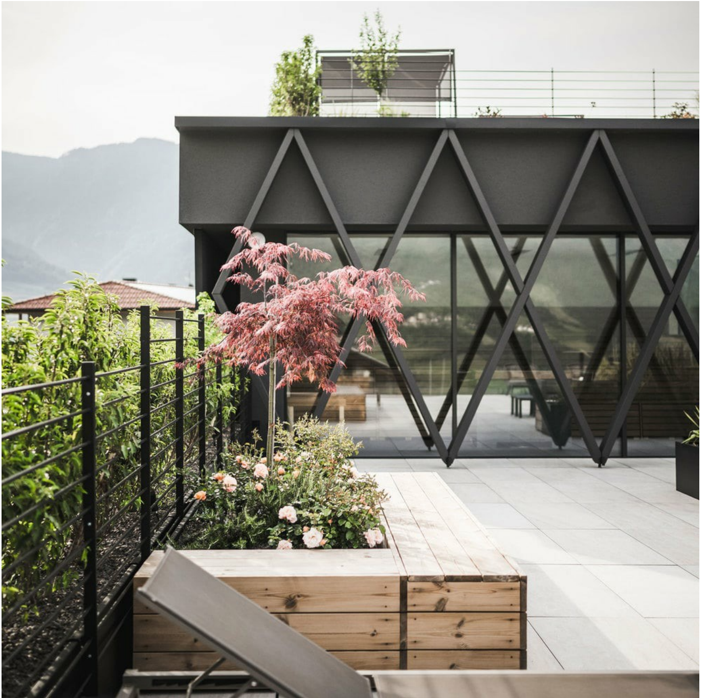
Nieuwbouw: Hotel in dorp Tirol Vorm, functie en vergezicht.

www.finstral.com/nl/referenties/nieuwbouw-hotel-in-de-buurt-van-het-dorp-tirol/311-12148.html